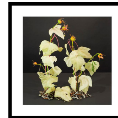
Vedben og hyben med skruer