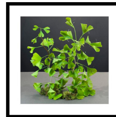
Ginkgo, knappenåle og mos