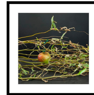
Troldhassel, snor og æble med orm