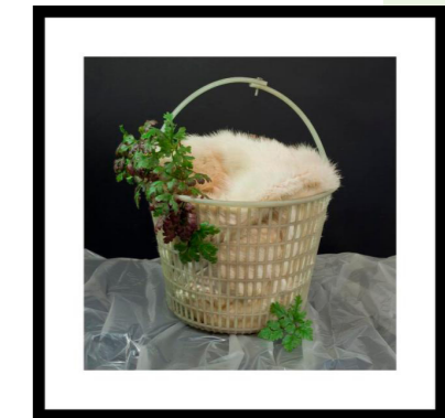
Storkenæb og mink