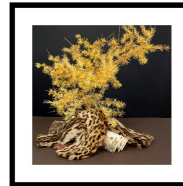
Ozelot med gul lærk og birkebrænde

Tag et billedet til opslaget og sigt efter at give billedet det samme udtryk som billederne i "Memento". Knyt evt. hashtags til opslaget.