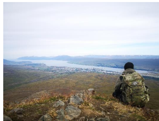
Billede: her er vi nået toppen af Súlúr mountain. Dette var med godt vejr.

Deres vand kan også se uklart ud ifbm. Der er flere luftbobler i vandet og mineraler end herhjemme, da de får deres vand fra de varme kilder i bjergene kan badevandet også lugte lidt af rådne æg men det er normalt derovre og ikke sundhedsfarligt, bare et spørgsmål om tilvænning.