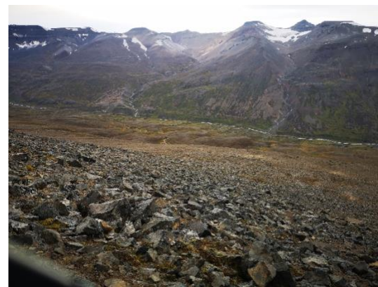
Billede: Siden af bjerget overfor Súlúr mountain. Dette var med godt vejr.

Deres vand kan også se uklart ud ifbm. Der er flere luftbobler i vandet og mineraler end herhjemme, da de får deres vand fra de varme kilder i bjergene kan badevandet også lugte lidt af rådne æg men det er normalt derovre og ikke sundhedsfarligt, bare et spørgsmål om tilvænnning.