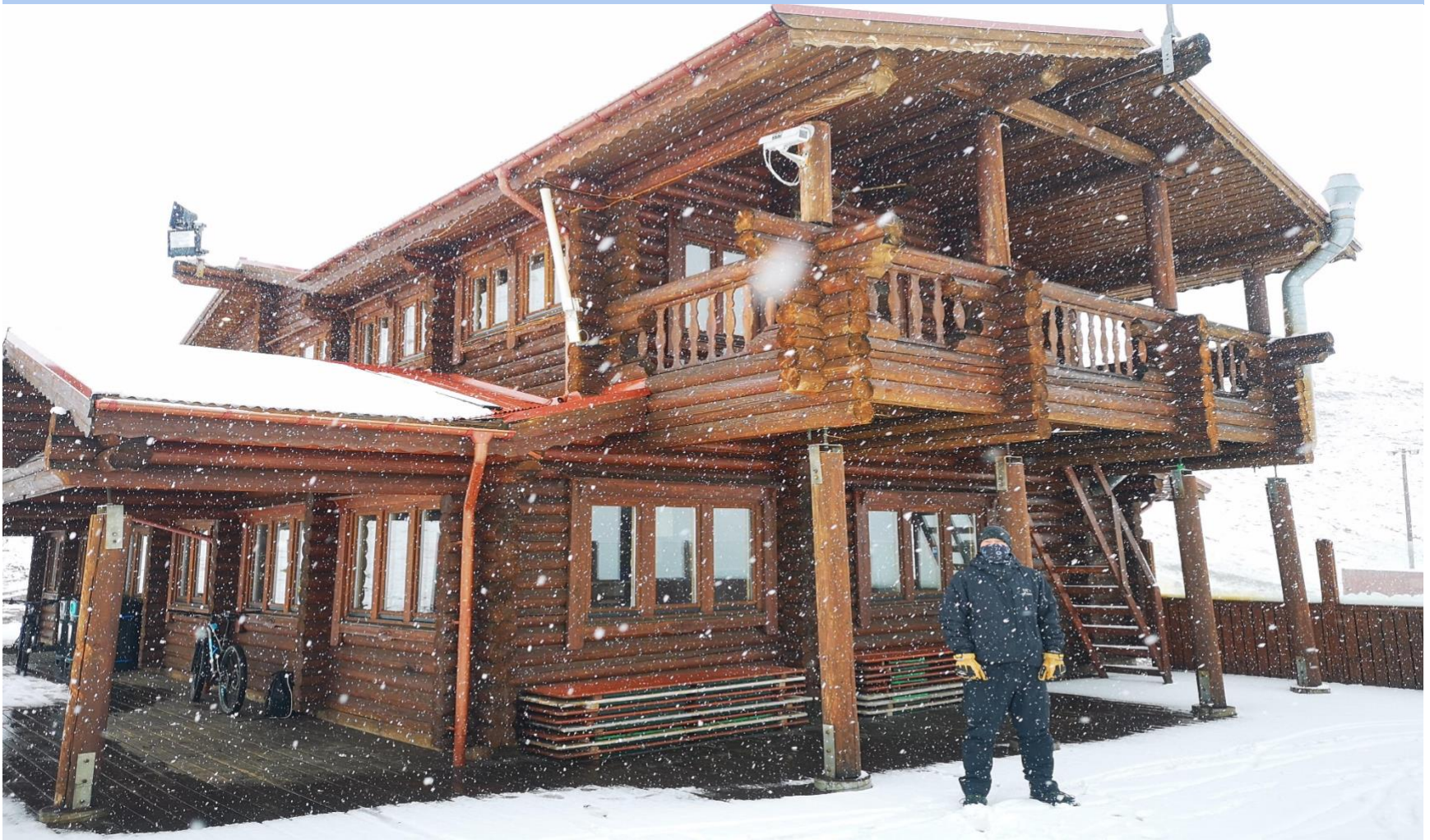
Billede: dette er taget af hytten på Hlíðarfjall som er i Akureyri, det sneede ikke nede i byen men når man ramte bjerget gjorde det.