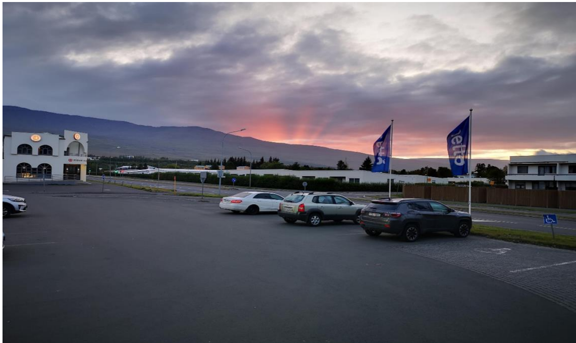
Billede: viser aftenudsigten over Akureyri fra vores Nettó der lå ca. 3-500 m fra der hvor vi boede hos Hinrik.